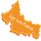
San Luis Potosí

Capital: Monterrey Número de municipios: 51